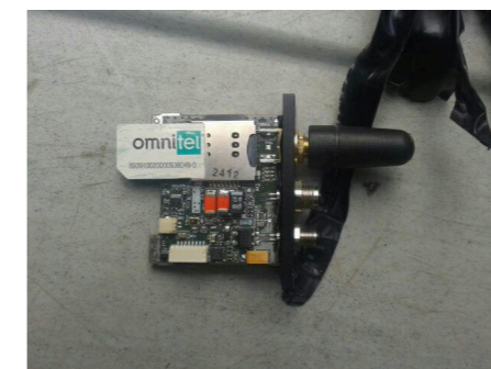
Un dispositif avec carte SIM trouvé dans un véhicule en Italie, en août 2019 5 .