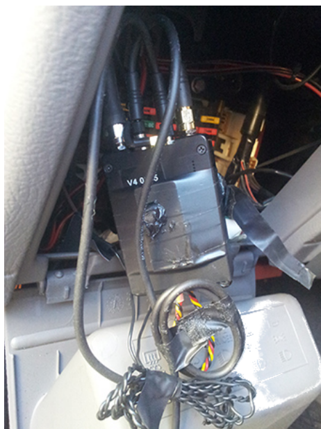
Des micros et une balise GPS trouvés dans la boîte à fusibles d'une voiture à Lecce, Italie, en décembre 2017. 2