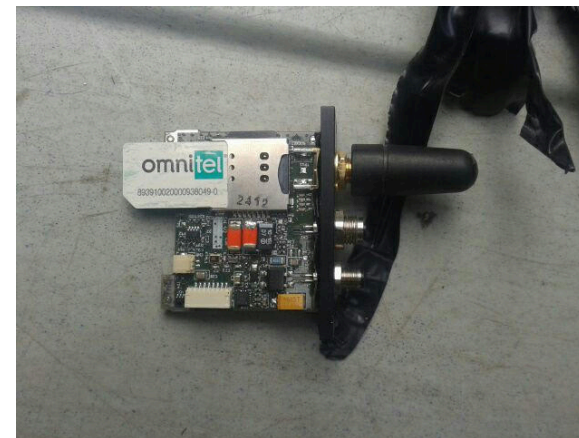
Un dispositif avec carte SIM trouvé dans un véhicule en Italie, en août 2019 5 .