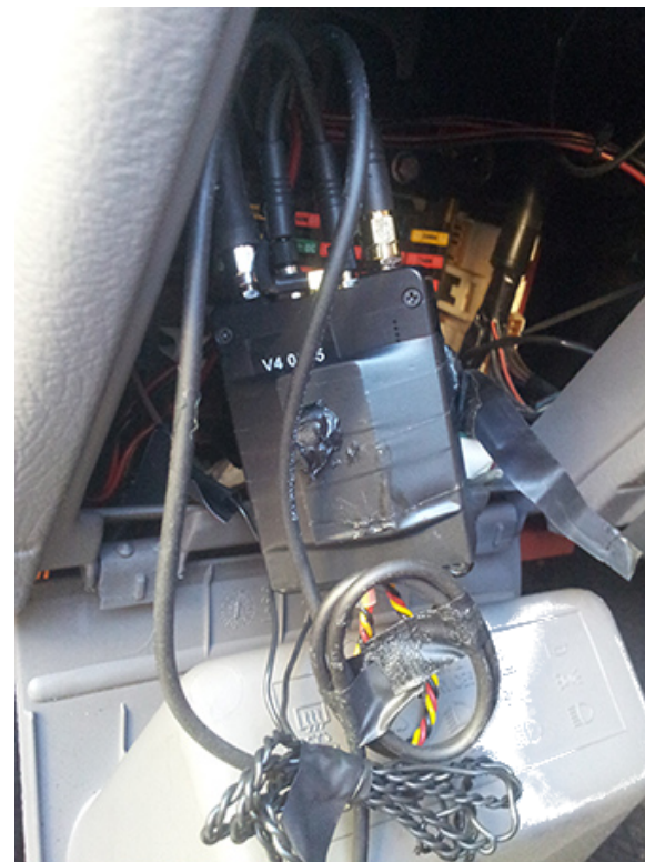
Des micros et une balise GPS trouvés dans la boîte à fusibles d'une voiture à Lecce, Italie, en décembre 2017 2 .