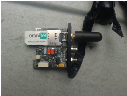
Un dispositif avec carte SIM trouvé dans un véhicule en Italie, en août 2019. 5