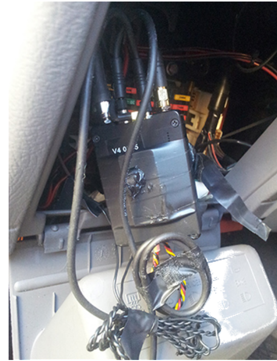
Des micros et une balise GPS trouvés dans la boîte à fusibles d'une voiture à Lecce, Italie, en décembre 2017 2 .