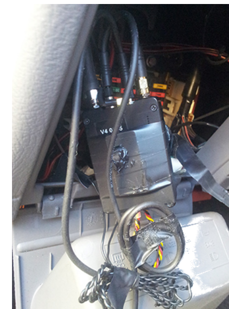
Des micros et une balise GPS trouvés dans la boîte à fusibles d'une voiture à Lecce, Italie, en décembre 2017 2 .