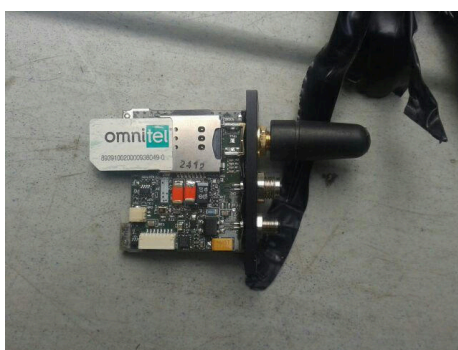
Un dispositif avec carte SIM trouvé dans un véhicule en Italie, en août 2019 5 .