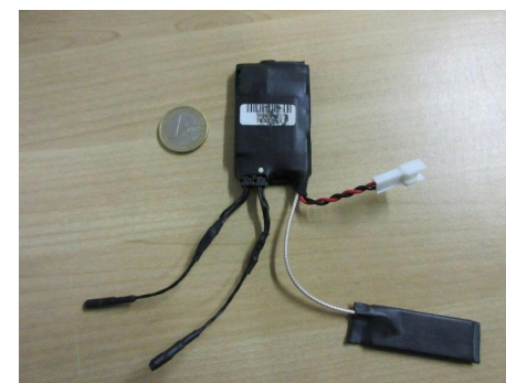
Micros trouvés dans une prise électrique dans un bâtiment à Bologne, Italie, en janvier 2018 1 .

Les dispositifs de surveillance physique dissimulés sont généralement utilisés par les agences de maintien de l'ordre et de renseignement pour obtenir des informations sur une cible lorsque les méthodes de surveillance traditionnelles sont insuffisantes. Par exemple, si un suspect ne discute jamais de sujets sensibles au téléphone, ce qui rend la surveillance de son téléphone inutile, les forces de l'ordre peuvent avoir recours à l'installation d'un microphone caché au domicile du suspect, dans l'espoir de capter des conversations intéressantes. Dans de nom-