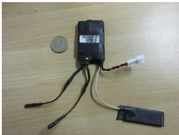
Micros trouvés dans une prise électrique dans un bâtiment à Bologne, Italie, en janvier 2018 1 .