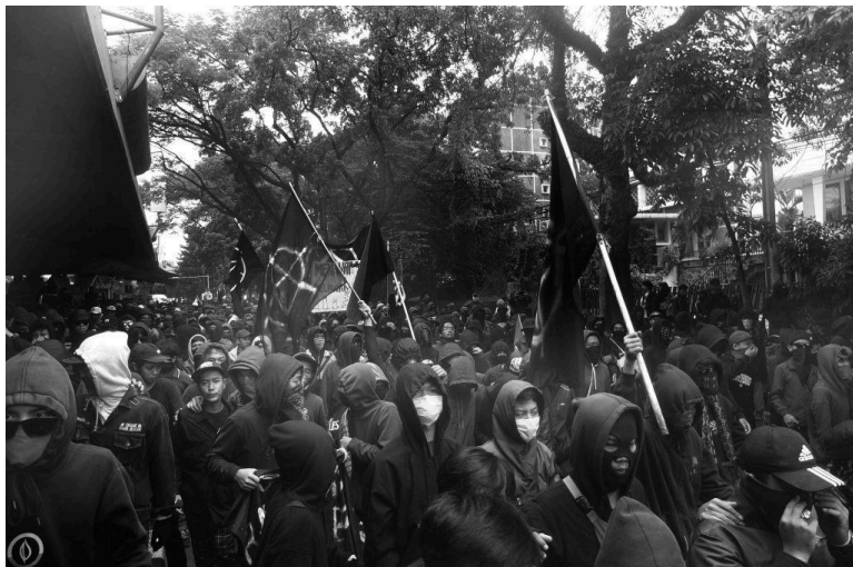
Una manifestación del black bloc en Bandung, Primero de Mayo de 2019.