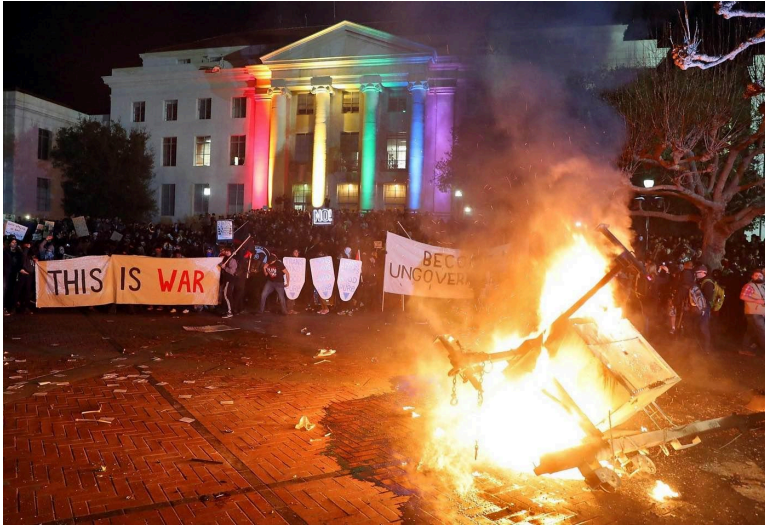
Manifestantes en Berkeley, California, el 1 de febrero de 2017. 20