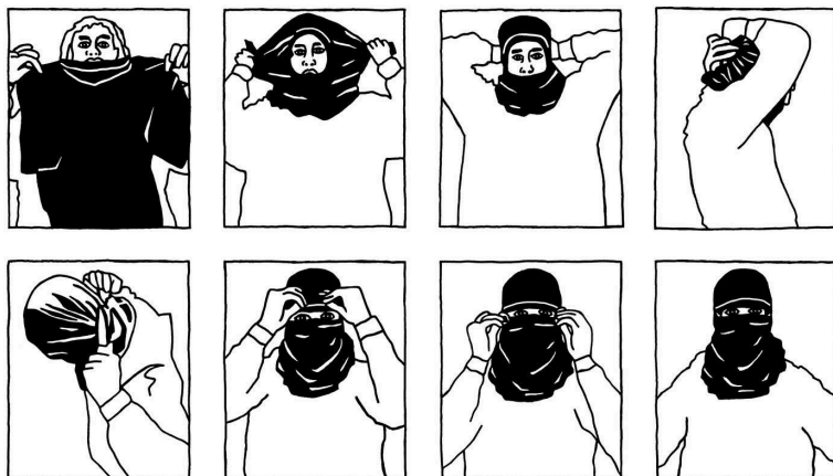
Cómo convertir una camiseta en una máscara.

Dependiendo de la frecuencia con la que se celebren las manifestaciones, tener que conseguir ropa para cada una de ellas por separado puede suponer un gran esfuerzo, por lo que solemos comprar varias prendas de cada tipo y guardar las que sobran en casa de un amigo de confianza. Robar en las tiendas es una forma de evitar interacciones memorables con la persona que está en la caja registradora, pero si se sospecha que alguien está robando, la tienda puede conservar las imágenes de las cámaras de seguridad durante más tiempo de lo habitual, y ser sorprendido in fraganti podría permitir a las autoridades atar cabos.