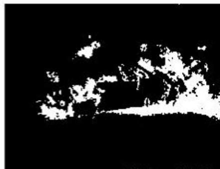
Abb. 2: LKA Berlin: Im Jahr 2011 ein häufiges Bild auf Berliner Straßen: brennender Pkw

Die zunehmende Modernisierung von Kraftfahrzeugen bietet nicht nur einen größeren Fahrkomfort, einen besseren Rundumschutz der Insassen und eine höhere Wirtschaftlichkeit, sie setzt auch neue Maßstäbe für die Brandursachenermittlung. Die fortschreitende technische Entwicklung in Kfz stellt eine ständige Herausforderung für den Ermittlungsdienst dar. Schon der enorme Anteil von elekt-