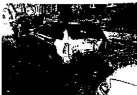
Abb. 5: LKA Berlin: Angezündete Kunststoffstößstange.

Bei den letztgenannten Versuchen können sich im Nahbereich oder unter den Fahrzeugen Reste von z. B. Papier, Pappe, Kerzen, Grillkohle, Plastik- oder Glasflaschen mit eingedrehten Stoffteilen finden lassen, die nicht dem Fahrzeug zuzuordnen sind.