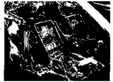
Abb. 3: LKA Berlin: BMW-Cabrio, massive Brandzerstörung, auf dem Fahrersitz teilverbrannter Papierstapel.

ronischen Bauteilen und Geräten bietet zwar bei den offensichtlich technischen Ursachen einen Ansatzpunkt. Aber gerade dieser ist – meist – unerreichbar in Kunststoff verkapselt und im Brandfall zumeist thermisch in dem Maße zerstört, dass Rückschlüsse unmöglich sind. Selbst Sachverständige stehen oft vor einem unlösbaren Problem und können sich dann nicht auf eine Brandursache festlegen.