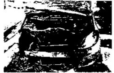
Abb. 7: LKA Berlin: A-Klasse Mercedes, Brandursache: Grillkohleanzünder auf dem rechten Vorderrad

Zudem wurden Polizeihubschrauber mit Wärmebildkameras eingesetzt, mit denen sich – auch bei Dunkelheit – aus großer Entfernung Personenbewegungen beobachten lassen. Einsatzkräfte in bür-