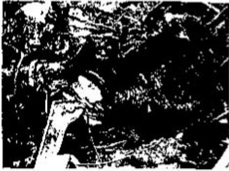
Abb. 4: Der Papierstapel auf dem Fahrersitz des BMW-Cabrio ist nur teilweise verbrannt und nach Löscharbeiten noch erkennbar. (Zündung mit offener Flamme, gleichzeitig flüssiger Brandbeschleuniger)