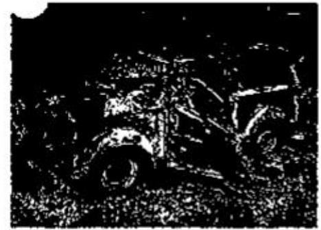
Abb. 6: LKA Berlin: Der linke Hinterreifen des Trabant ist als Spureenträger erhalten.

Bei den Brandermittlungen ist das veränderte Abbrandverhalten durch den höheren Einsatz von Kunststoffen, Aluminium und Magnesium-Legierungen zu beachten. Durch die Verkürzung der Brandübertragungszeitspannen zwischen Motorraum, Kabine und Kofferraum erklären sich von Zeugen wahrgenommene Knallgeräusche während des Brandes, die i. d. R. auf die ausgelösten pyrotechnischen Gurtstraffer oder zerplatzenden Reifen zurückzuführen sind.