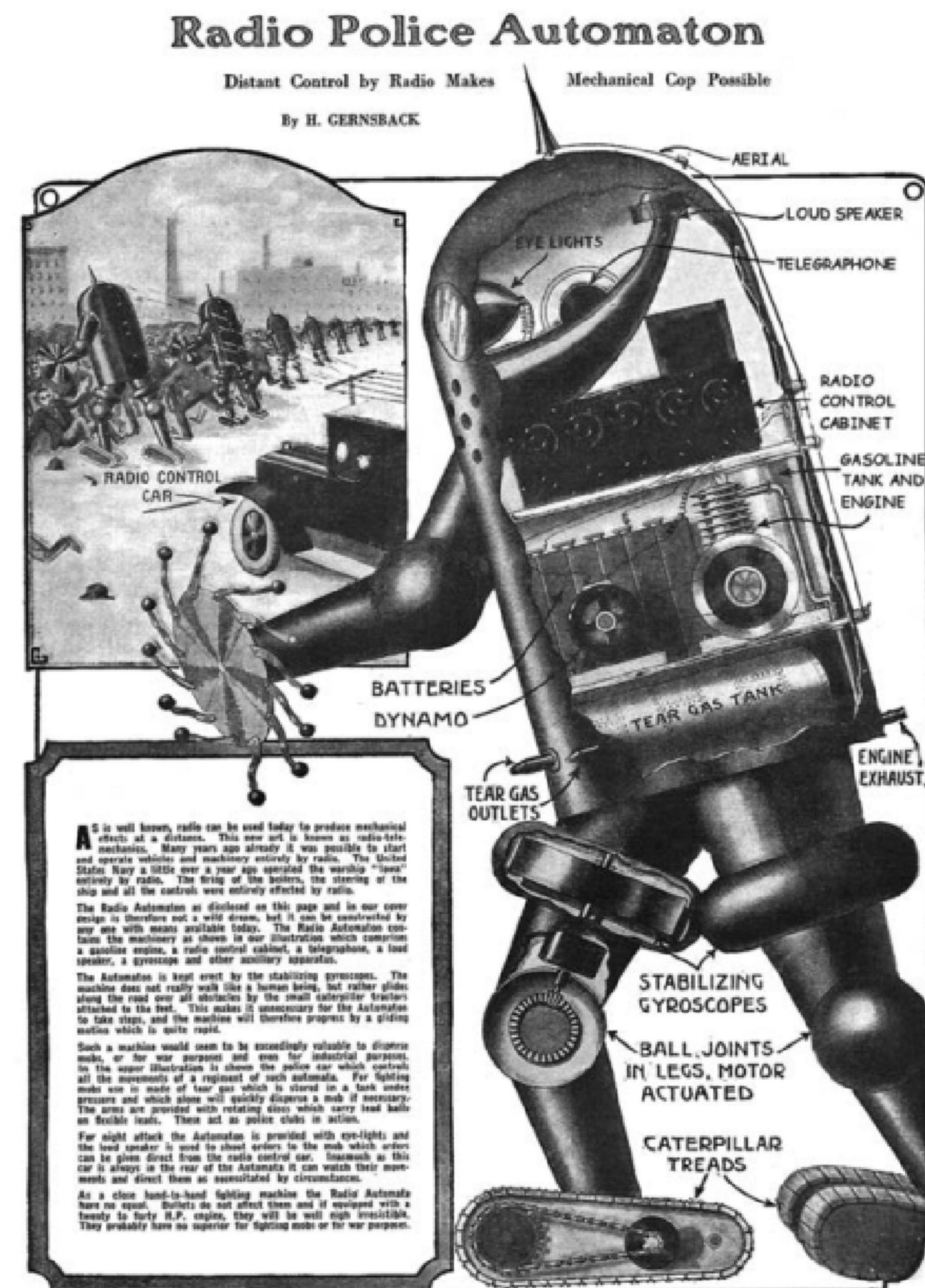
A radio-controlled police automaton. From Hugo Gernsback, "Radio Police Automaton," Science and Invention 12, no. 1 (May 1924): 14.

Copertina: The eye of God. From Horapollo, Ori Apollinis Niliaci: De sacris notis et sculpturis libri duo (Paris: Kerver, 1551), 222.