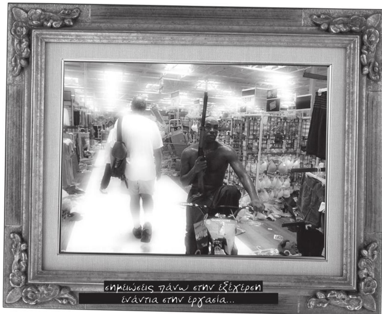
σημειώσεις πάνω στην εξέχερση ενάντια στην εργασία...

* Η άρνηση εργασίας δεν είναι ευφυολόγημα. Δεν είναι πρόφαση. Δεν είναι όπλα και δρομολόγια διαφυγής. Συνιστά αντίληψη και πρακτική, ένα πλούσιο περιθώριο δυνατοτήτων που έχει παραχθεί μέσα στα πεδία της κοινωνικής εμπειρίας και της ανατρεπτικής δράσης.