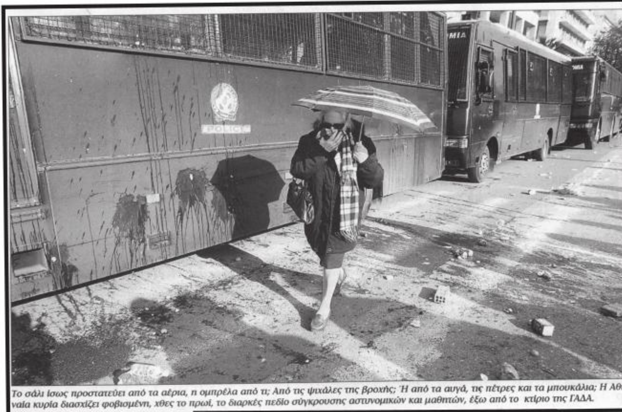
Το σάκι ίσως προστατεύει από τα αέρια, η ομπρέλα από τη βροχή, οι ψιχάλες της βροχής; Ή από τα αυγά, τις πέτρες και τα μπουκάλια; Η Αθηνναία κυρία διασχίζει φοβισμένη, χθες το πρωί, το διαρκές πεδίο σύγκρουσης αστυνομικών και μαθητών, έξω από το κτίριο της ΓΑΔΑ.

Τις αιτίες της εξέγερσης -αλλά και της κατανόησής της από μεγάλο κομμάτι του κοινωνικού σώματος- θα τους αναγνωρίσουμε στην αποδυνάμωση όλων των "υποσχέσεων" που μέχρι τώρα απλόχερα μοίραζε η εξουσία. Στην απαξίωση όλων των μηχανισμών διαμεσολάβησης. Η ευμερία, ο πλούτος, το γόπτρο, η εξουσία -βασικά όπλα από τις αρχές του '90- δεν μπορούν να αποτελέσουν καν διαφημιστικό κόλπο της δημοκρατίας. Η κατανάλωση ως ιλουστρασιόν κάτεργο που παράγει και αναπαράγει την κοινωνική ζωή, ως βασικός μηχανισμός εσωτερίκευσης των κυρίαρχων αξιών χάνει διαρκώς την αποτελεσματικότητά της. Ταυτόχρονα κόμματα και συνδικάτα αδυνατούν όλο και πιο συχνά να ελέγξουν και να διαχειριστούν την δυσαρέσκεια, αφήνοντας ανοικτό το ενδεχόμενο να απελευθερωθεί και να μετασχηματιστεί σε οργή. Αυτό έχει σαν άμεσο αποτέλεσμα να αναπτύσσεται -ακόμα και σε αγώνες που κάποιο καιρό πριν θα διεξαγόταν μέσα σε κλίμα μιας γραφικής νομιμότητας- μια έντονη δυναμική. Οι "από κάτω" βρίσκονται πιο κοντά στον κόσμο της άμεσης αντιπαράθεσης για ζητήματα που πριν θα διαμεσολαβόντουσαν από δημοτικούς σύμβουλους, πολιτικούς, δικαστικούς αγώνες, συνδικαλιστές ή δημοσιογράφους. Ενώ οι "από πάνω" δεν έχουν άλλη λύση από το να καταφεύγουν στα δακρυγόνα, τους παρακρατικούς, τους εισαγγελείς, τους αστυνομικούς συντάκτες.