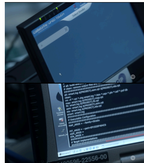
Discrète incursion dans la culture populaire : un membre de la DGSE utilisant un UFED Touch pour trouver des métadonnées sur un smartphone dans la série « Le Bureau des légendes ».

Ces boîtiers sont également capables de tirer profit de failles de sécurité connues pour extraire des informations supplémentaires. Pour cela, ils analysent l'appareil pour détecter le modèle et les versions des logiciels installés. Cette première phase de reconnaissance au moment du branchement de l'appareil visé permet aussi de récupérer des informations de base, plus ou moins non protégées car nécessaires au bon fonctionnement de l'appareil. Cela peut inclure dans le cas d'un téléphone par exemple le numéro IMEI (qui identifie le téléphone lui-même sur le réseau, indépendamment de la carte SIM), le numéro ICCID (la carte SIM), son fuseau horaire, et éventuellement le modèle et la version d'Android/iOS installée. Grâce aux informations collectées, ils interrogent leur base de données pour