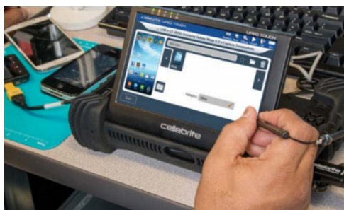
La version « Touch » de leur gamme d'UFED.

cartes SIM ou encore des smartphones. Mais plus que cela, cet appareil permet selon la firme d'intégrer cette extraction de données à l'interrogatoire d'une personne (en garde-à-vue ou à une frontière), tantôt en utilisant les informations obtenues lors de l'interrogatoire pour tenter de débloquent des données, tantôt en utilisant les données extraites lors de l'interrogatoire. Le « Kiosk » n'est en revanche qu'une version mobile et un élément de l'écosystème vendu aux gouvernements : d'autres outils offrent la possibilité de faire de la traduction en temps réel, de consulter leurs experts à distance, etc.