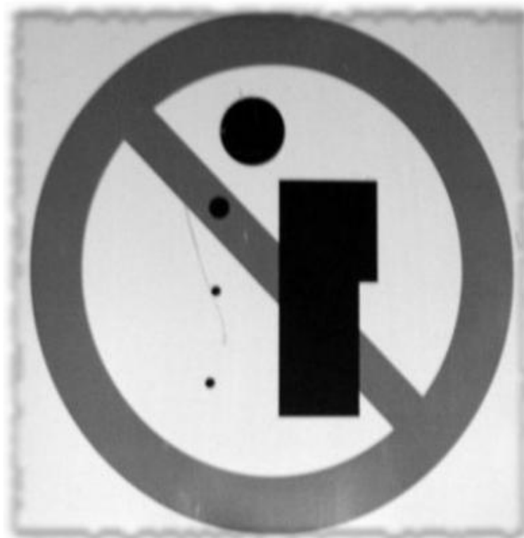
panneau « interdiction de cracher », Inde

articles 706.54, 706.55 et 706.56 du Code de Procédure Pénale.